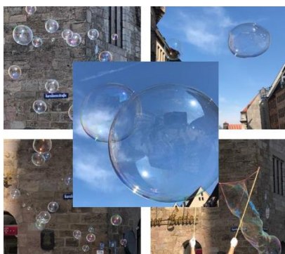
Foto: aufgenommen in der Fußgängerzone Nürnberg

„Warum muss alles Schöne immer so schnell vergehen und währt gefühlt nicht länger wie die Lebensdauer einer Seifenblase?“